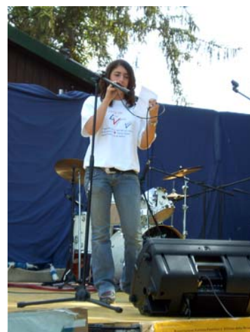
Sede di Asti Concorso "Oltre la valle"