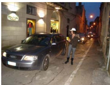
Sede di Maglie (LE)

Tale obiettivo è perseguito dal Coordinamento mediante l'organizzazione mensile di seminari di informazione tenuti da esperti su specifici temi nonché di campagne di comunicazione e manifestazioni rivolte a cittadinanza, amministratori e commercianti, mirate a scoraggiare l'uso di automezzi nel centro cittadino e a sostenere comportamenti maggiormente rispettosi delle regole della convivenza civile da parte dei cittadini magliesi.