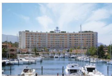
Sicily Awards 2007