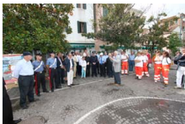
Sede di Venezia