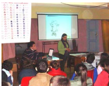
Sede di Rocca di Capri Leone